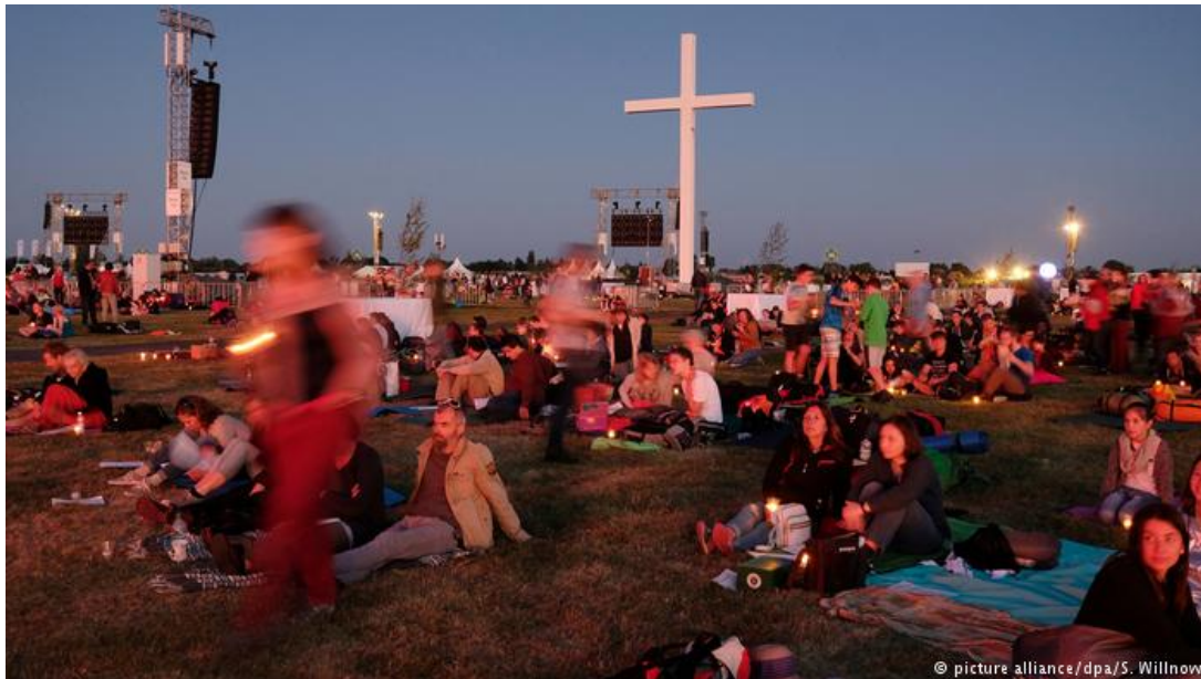
Woodstock in Wittenberg: Ökumenische Nacht der Lichter mit Zehntausenden Gläubigen auf den Festgelände