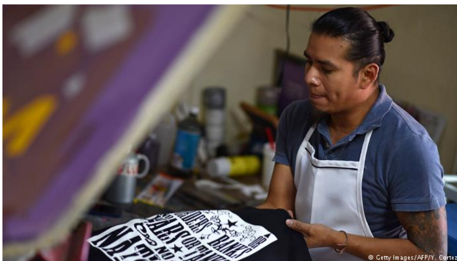
A loja de serigrafia "Deportados Brand" produz camisetas com estampas anti-Trump