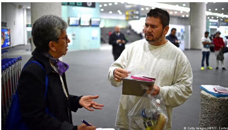
Deportado mexicano (d) recebe orientação no aeroporto da Cidade do México