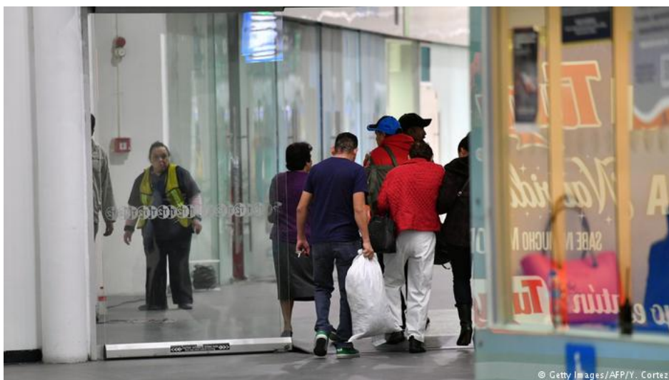
Mexicanos deportados chegam ao aeroporto internacional Benito Juárez, na Cidade do México

Mexicanos que emigraram para os EUA e retornam ao país natal não recebem qualquer apoio do governo. Se programa de proteção dos "dreamers" acabar, situação poderá se tornar caótica.